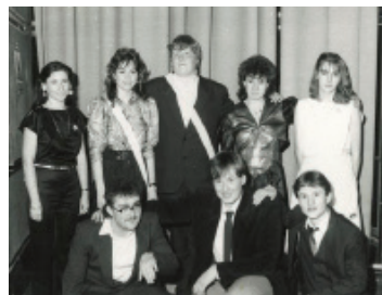
Vzpomínka na maturitu