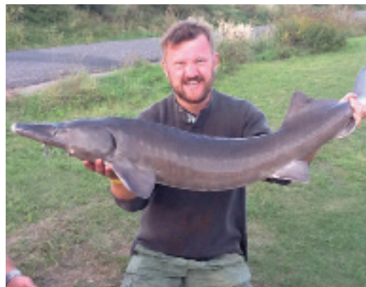
S parádním úlovkem se přátelům chlubí i na Facebooku