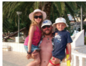
S dětmi na dovolené u moře