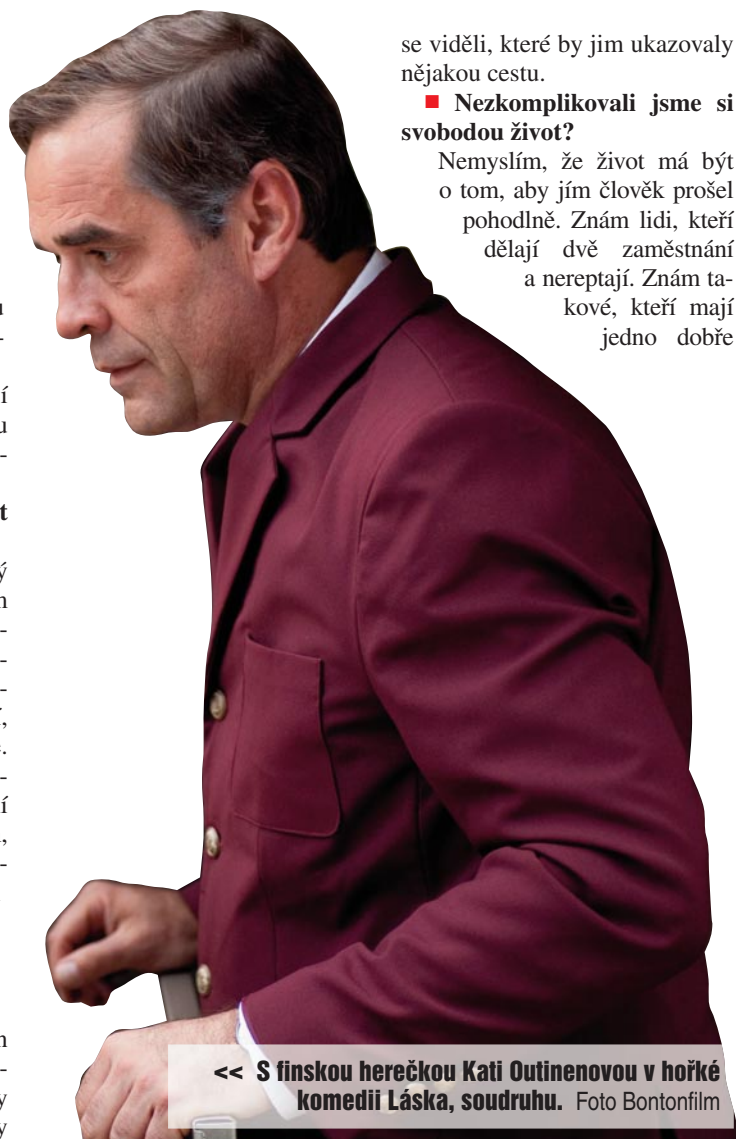
<< S finskou herečkou Kati Outinenovou v hořké komedii Láska, soudruhu.