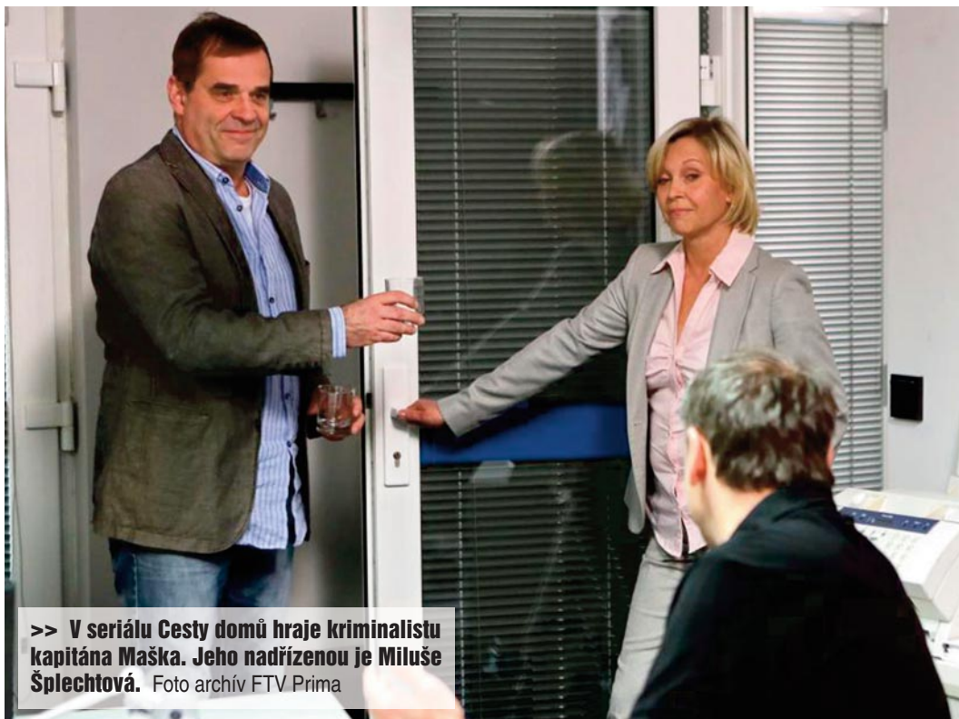
>> V seriálu Cesty domů hraje kriminalistu kapitána Maška. Jeho nadřízenou je Miluše Šplechtová.

zaplacené a neustále nadávají. Změna, která před 25 lety přišla, přinesla řadu plevelných nehezkykých věcí – včetně toho, že se politická scéna nedokáže domluvit na zásadních věcech. Nicméně věřím, že za dalších 25 let to bude dobré. To už snad nepůjde o rychlé zbohatnutí.